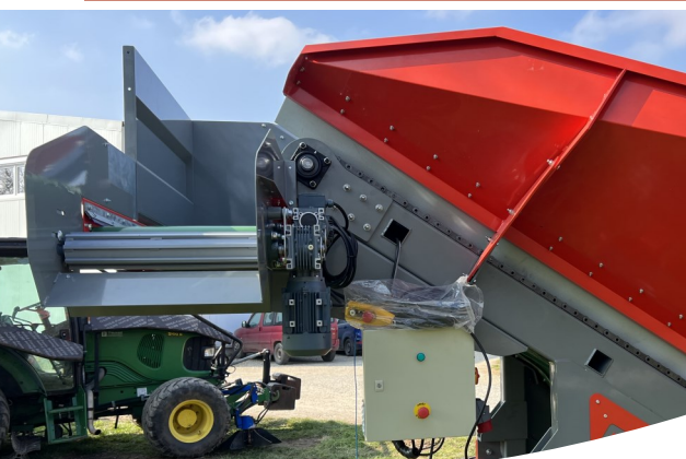
ELIMINADOR DE RAMAS DE RODILLOS Y TABLERO ELÉCTRICO