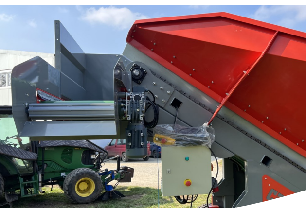
ELIMINADOR DE RAMAS DE RODILLOS Y TABLERO ELÉCTRICO