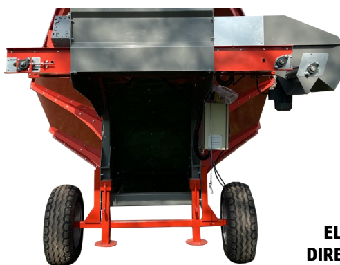
RUEDAS Y TACOS REGULABLES