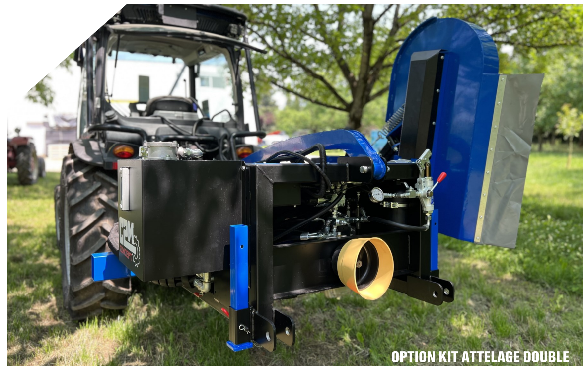
OPTION KIT ATTELAGE DOUBLE